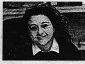
La procuratrice pubblica Margherita Lanvella avrebbe voluto una pena un po' più severa. (fotogramma)

Su e giù da un paesello lombardo, dove dimora, al Canton Ticino (Sottoceneri: Mendriccio e Luganese). Su e giù per un anno intero. Per fare quel che per lui è un gioco: furti di qua e furti di là. Per lo più in auto posteggiata, senza disdegnare le abitazioni e qualche altro posto dove l'occasione si rivela ghiotta e impensabile (compreso il Casale Adriatico). Bombole, soldi, cellulari, gioielli, altri oggetti di valore e carte di credito. Queste ultime utilizzate, poi, per fare pronostici e ulteriori... saccheggi. Cospicuo anno, italiano, per due migliaia di euro di riciclaggio e 15.000 lire incassate dal gennaio al dicembre 2011 - se Te Cavata con la condizionale. Quindici mesi sospesi per un periodo