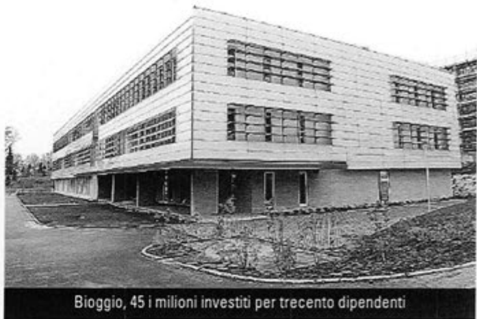
Bioggio, 45 i milioni investiti per trecento dipendenti

co: le sale riunioni "a sbalzo" verso la hall. Il design è stato studiato in ogni singolo dettaglio e gli accessori sono futuristici. Ma la nuova casa di Acer, per la quale la casa madre ha investito 45 milioni di franchi, i cui lavori per il 70% sono stati affidati a ditte ticinesi, è all'avanguardia dal profilo dell'approvvigionamento energetico. Anzitutto, emissioni pari a zero siccome non sarà usato olio da riscaldamento né gas. Solo un po' di elettricità per alimentare le pompe di calore che sfruttano invece la temperatura dell'acqua di falda a 13°. Il resto è pure stato realizzato con l'obiettivo di ridurre i consumi. Come le facciate che sono state rivestite in cristallo bianco con lame frangisole che seguono l'andamento del clima e del sole.