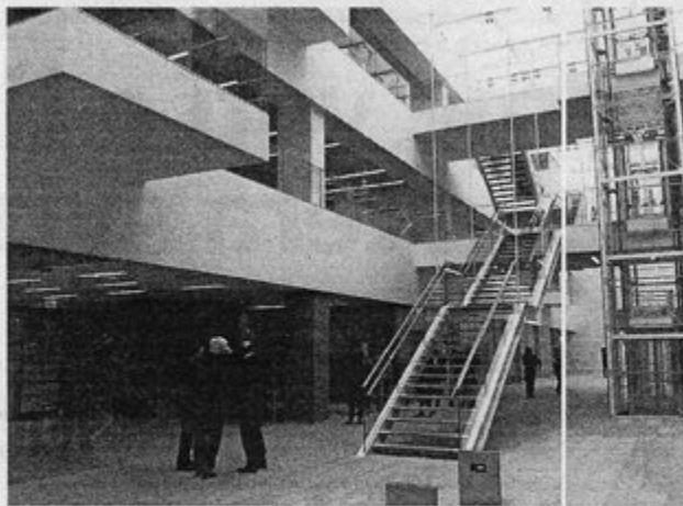
La grande hall centrale con spazi aggettanti.